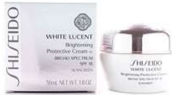
米国商標登録第3216053号