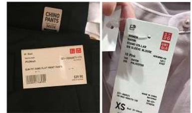
米国商標登録第3352686号